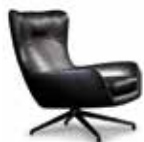
4 JENSEN BERGÈRE CM 81X97 H94