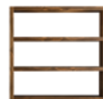
12 JOHNS BIBLIOTHÈQUE CM 180X40 H174